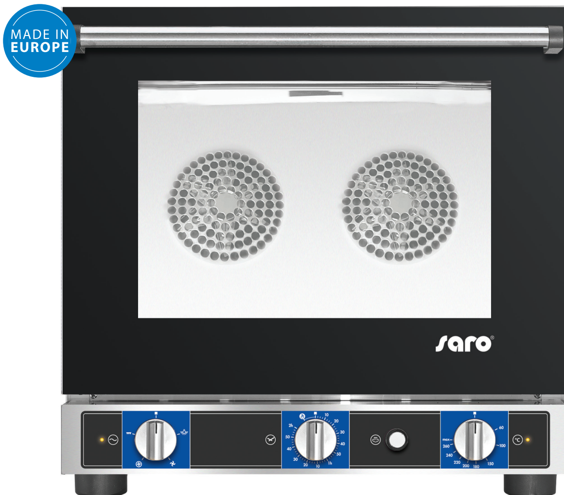
PF 5004 P