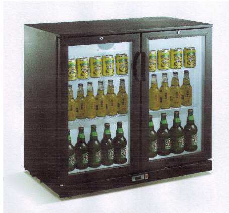
Modell MARA 2