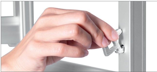
Werkzeugfreie Montage Tool-free assembly