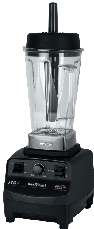
TM -767 black

Model JTC OMNIBLEND TM-767 (2 Liter) Order-No. 329-2010 Order-No. 329-2100