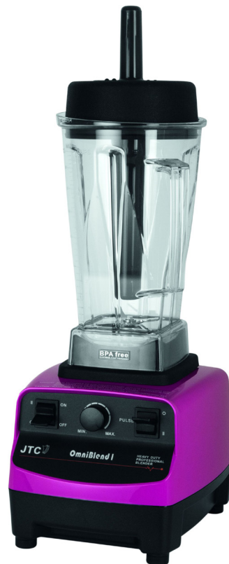
TM -767 pink